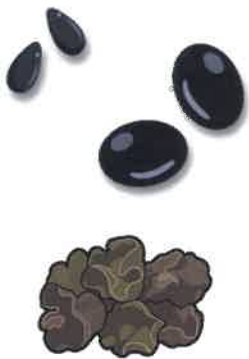
黒ごま、黒豆、黒キクラゲなど