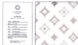
ダイヤモンド 鑑別書付 ※プリント柄の見本

イオン発生する鉱石粉末に熱伝導率に優れた天然ダイヤモンド粉末をブレンドしてプリントしています。