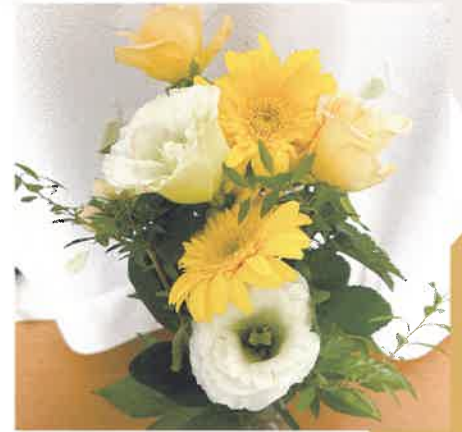
お誕生日にいただいたお花

そしてこれからも気候変動は私たちの日常生活に大きな影響を及ぼし続けてくるでしょう。(秋バテ)(気象病)も現在社会が生み出した言葉。そこで重要なカギを握るのが、皆さまご存知の【セルフメディケーション】